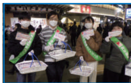
啓発キャンペーン